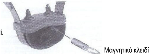
Διάγραμμα 3 Ενεργοποίηση/ Απενεργοποίηση του κολάρου με το μαγνητικό κλειδί.

Διάγραμμα 3: Ενεργοποίηση/ Απενεργοποίηση του κολάρου με το μαγνητικό κλειδί.